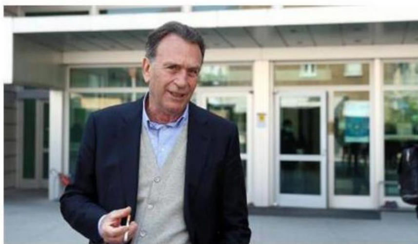
Il presidente del Brescia Massimo Cellino davanti al Palagiustizia di Brescia

Un passaggio importante Certamente però, il proscioglimento dall'accusa di aver commesso reati fiscali per il presidente del Brescia e dell'altro imputato, Daniel